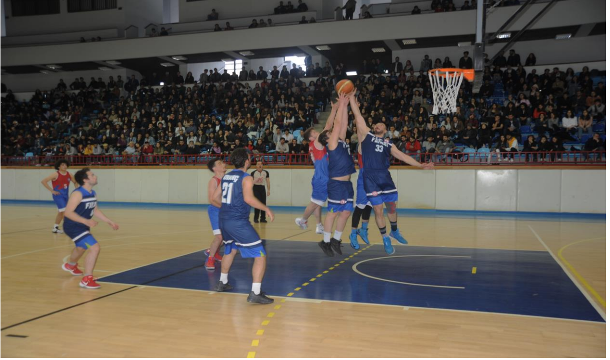
39. Spor Şöleni Basketbol Müsabakası

09-13 Aralık 2019 tarihleri arasında Üniversite Sporları Federasyonu tarafından düzenlenen ve Üniversitemiz ev sahipliğinde gerçekleşen “Üniversitelerarası Voleybol 2. Lig Erkek-Bayan” müsabakaları 12 takımın katılımı ile Hasan Polat Beden Eğitimi ve Spor Merkezinde yapılmıştır.