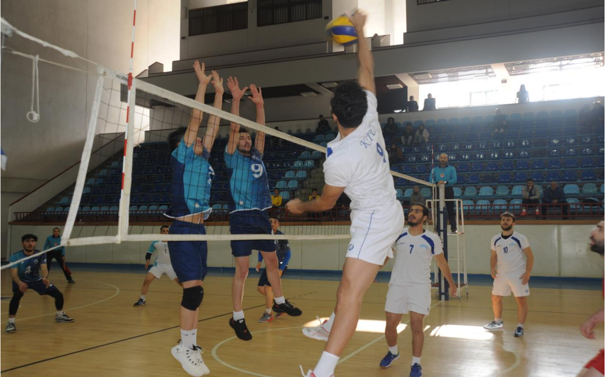
Üniversitelerarası Voleybol 2. Lig Müsabakası

09-13 Aralık 2019 tarihleri arasında Üniversite Sporları Federasyonu tarafından düzenlenen ve Üniversitemiz ev sahipliğinde gerçekleşen “Üniversitelerarası Voleybol 2. Lig Erkek-Bayan” müsabakaları 12 takımın katılımı ile Hasan Polat Beden Eğitimi ve Spor Merkezinde yapılmıştır.