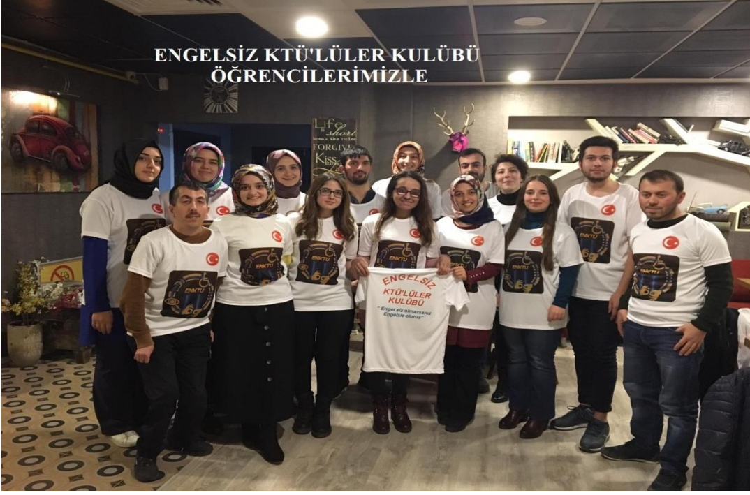
Engelsiz KTÜ'lüler Kulübü öğrencilerimize, "Engel siz olmazsanız Engelsiz oluruz" yazılı tişörtlerimizin dağıtımı yapıldı.