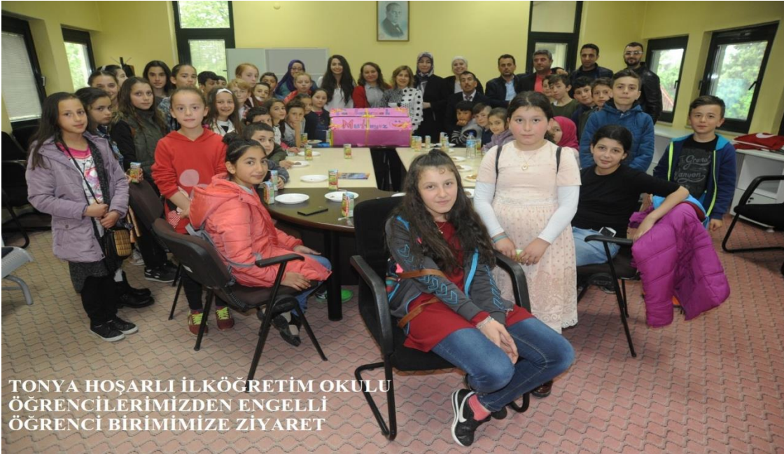
TONYA HOŞARLI İLKÖĞRETİM OKULU ÖĞRENCİLERİMİZDEN ENGELLİ ÖĞRENCİ BİRİMİMİZE ZİYARET