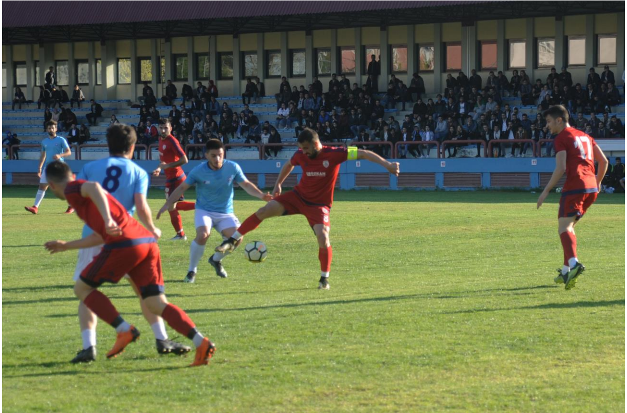
39. Spor Şöleni Çim Saha Futbol Müsabakası

12 Mart-26 Nisan 2019 tarihleri arasında yapılan 39. Spor Şöleni müsabakalarında 1800'e yakın öğrenci ve personelimiz aktif spor yapmış bulunmaktadır.