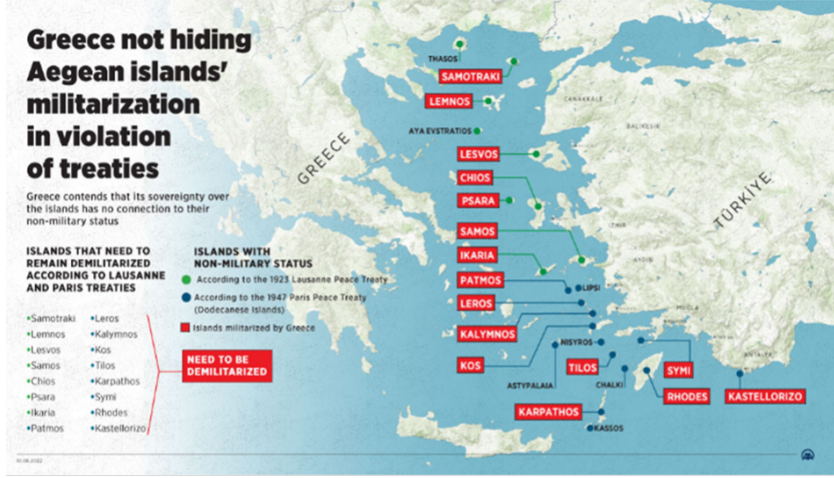
Tablo 3: Yunanistan Tarafından Silahlandırılan Adalar