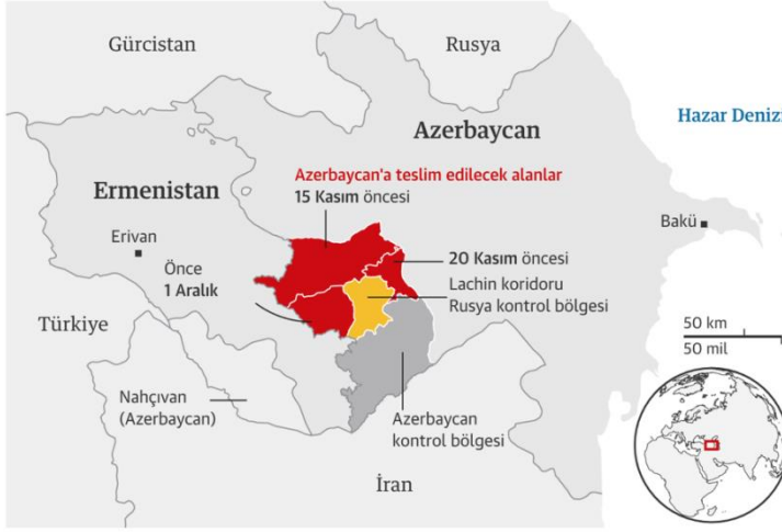
Tablo 1: Azerbaycan-Ermenistan Sınırlarının Son Hali

seçimiyle geldiğini bu sebeple halkın seçimiyle gideceğini belirtmiştir.