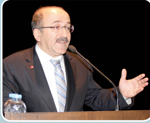
Trabzon Büyükşehir Belediye Başkanı Orhan Fevzi Gümrükçüoğlu