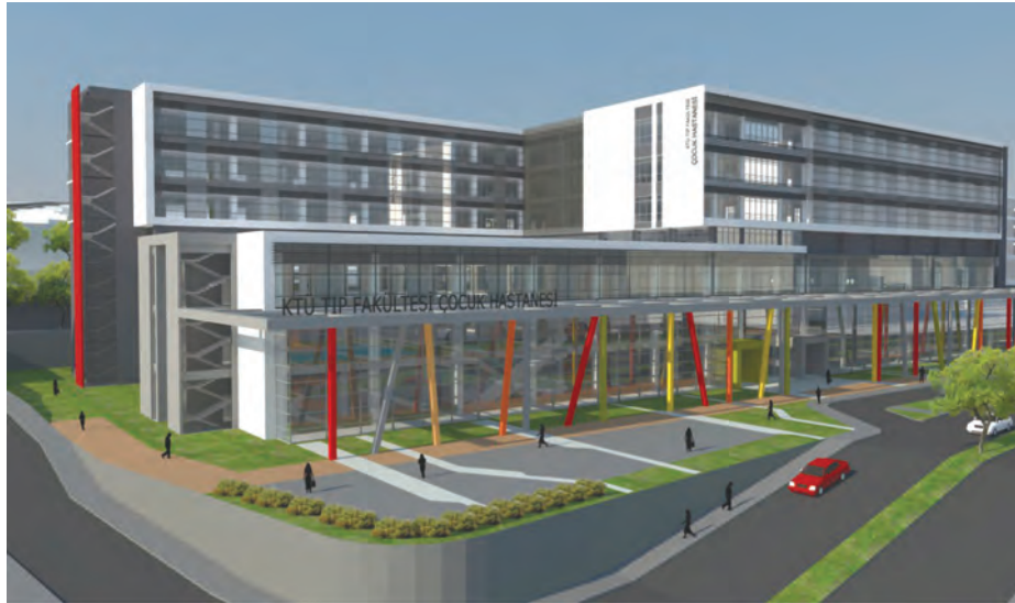
KTÜ Çocuk Hastanesi

Üniversitemizde hangi tezler yapıldı, hangi projeler yürütüldü ve hangi Ar-Ge laboratuvarları var. Hepsini artık KTÜ Web Sitesine konularak kamuoyu ile paylaştık.