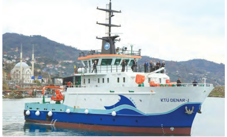
KTÜ DENAR-1 Bilimsel Araştırma Gemisi

Suya indirilen KTÜ DENAR-1 Bilimsel Araştırma Gemimiz, Karadeniz'deki araştırmalarına devam ediyor.