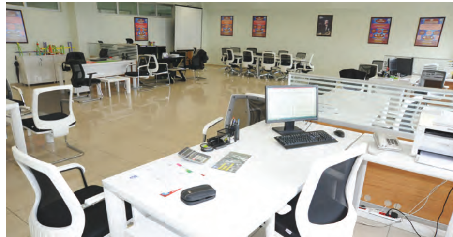
Proje Destek Birimi

Uzaktan Eğitim Merkezimizin yeniden yapılandırılması sürecinde sona gelindi. Yeni binası, stüdyoları ve