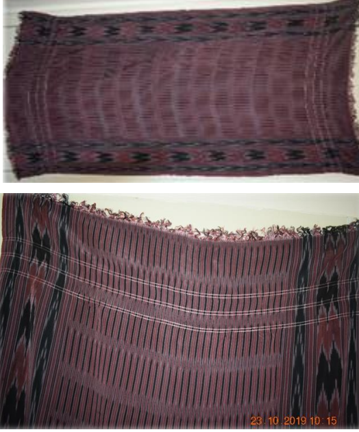
Resim 3. Keşan Peştamal (Futa Peştamal) ve Detayı (Erzurum/Palandöken ilçesi-Fahriye Selçuk'un Evi)

şeritlerden oluşan bir düzenleme yer almaktadır. Dokumanın zemininde de siyah, bordo ve beyaz renklerle oluşturulan mihrap motifinin tekrarı bulunmaktadır.