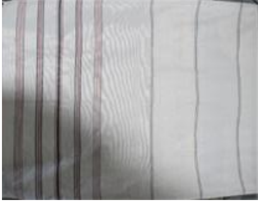
Resim 4. Tamzara Dokuması ve Detayı (Giresun/Şebinkarahisar-Tamzara Mah.-Şükran Küçükçü)

cm eninde dokunmaktadır. 22 Tamzara bezi, mendil, bez, peçete, yatak çarşafı, döşemelik, kadınların sokağa çıkarken başlarına aldıkları örtü ve bellerine bağladıkları önlüklerde kullanılmış, günümüzde ise masa örtüsü, sehpa örtüsü, perde, şal, kravat, fular, gömlek gibi birçok tekstil ürününde kullanıldığı görülmektedir.