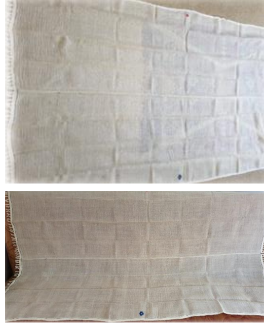
Resim 6. Ehram Dokuması (Artvin/Yusufeli İlçesi-Halk Eğitim Müdürü Selim Silacı Koleksiyonu)

Artvin'in Yusufeli ilçesinde yapılan, ancak günümüzde kaybolmuş dokumalardan olan "ehram" dokumada kuzu yünü kullanıldığı ve çok ince eğrilmiş yün ipliğinin "kuy" denilen tezgâhta dokunarak düğünlerde şal ya da baş örtüsü olarak örtüldüğü, ancak günümüzde bu dokumaların bazı evlerde kadınların sandıklarında hatıra olarak saklandığı bilinmektedir. Ehram dokumalara yörede "hanımeliçar" ya da dokumanın kenarına yapılan motiflerde kırmızı rengin kullanılması nedeniyle "kenarı kırmızı" olarak isimlendirilmiştir. Özel günlerde kullanılan bu örtü, kullanan kişiye bir statü ve saygınlık katmakta ve bu nedenle çözgü ve atkısında ince eğrilmiş yün ipliğiyle çok muntazam dokunmasına özen gösterilmektedir. 24 Artvin'de baş veya omuza almak biçiminde kullanılan bu ehramların eni, Bayburt ehramlarından daha dar yapılmaktadır.