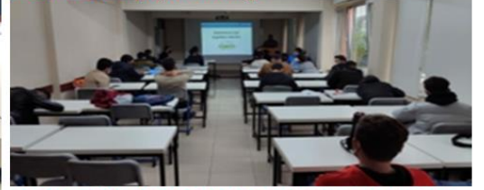
TS EN-15266 Doğal Gaz Hortumları" konulu teknik seminer