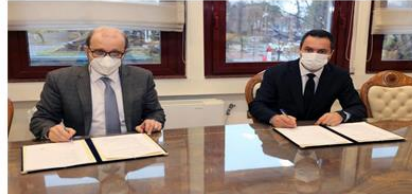
Mobilyacı İş Adamları Derneği (MOBİAD) ile iş birliği protokolü