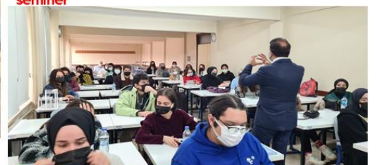
İçmimarlar Odası semineri