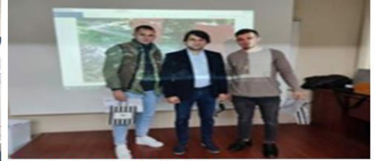
Mezunlarla söyleşi 2 etkinliği