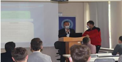
Arsin Gençlik ve Spor İlçe Müdürlüğü faaliyetleri adlı seminer